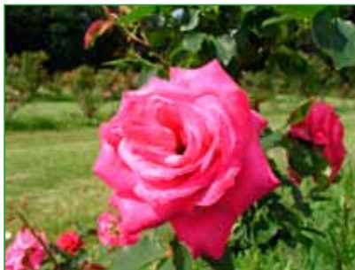
PRŮHONICE, sadovka, Večeřa, 1973