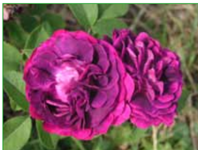
GENERAL ŠTEFANIK, sadovka, J. Böhm, 1932 foto 7