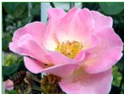
DR. ECKENER, pnoucí