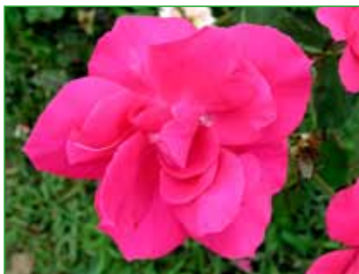
ZORKA, floribunda, L. Večeřa, 1975