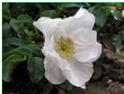
BLANKA, sadovka, V. Benetka, 1993