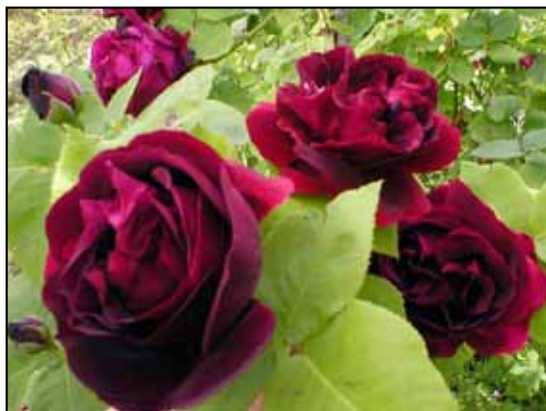
EUGENE FÜRST, remontantka, Soupert & Fürst, 1875

Pokud se chystáte pořídit si staré růže může vám při rozhodování pomoci následující seznam doporučených odrůd pro české podmínky , který pochází od již zmiňovaného M. Fulína, zahradníka a redaktora „Časopisu českých zahradníků“. Je samozřejmě 120 let starý, ale tím spíš je důvěryhodný, protože je z doby, kdy se tyto růže masově pěstovaly a byly s nimi bohaté zkušenosti – zmiňované odrůdy přestály extrémní zimu 1879/1880, kdy teploty několik dní v noci klesaly Zpravodaj Rosa klubu ČR č. 98