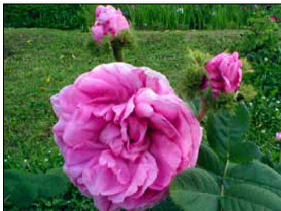
CRISTATA, mechovka, uvedena do prodeje 1827

zeminy. Nad tím vším se nakonec vytvořilo zastřešení z prken tak, aby se žádná vlhkost z deště a sněhu nedostala k růžím. Samozřejmě se pečlivě obalovaly slámou i kmínky aby napnuté pletivo nepromrzlo a nepoškodilo se. (Na drobné růže „vavříny“ se po zakrytí zeminou nasazovaly velké keramické květníky kterým se zaslepil odtokový otvor proti vnikání vlhkosti.) Proto není divu, že se většina pěstovala v tzv. „hrncích“ se kterými bylo možné snadno manipulovat a tak mohly být letněny zapuštěné v záhonech v polostínu a zimovány ve hřejnách. Pro venkovní pěstování ve volné