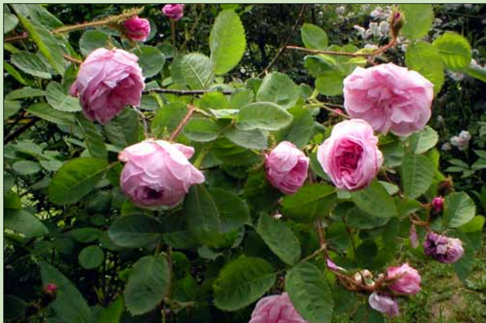
Centifolia moschata, mechovka