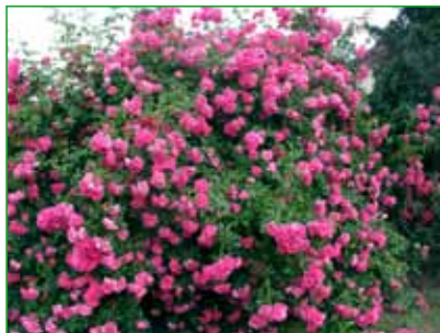
RUDOLFÍNA, pnoucí, V. Benetka, 2002