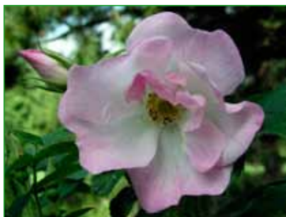
JABLOŇOVÝ KVĚT, V. Benetka, 1996 fotot 9