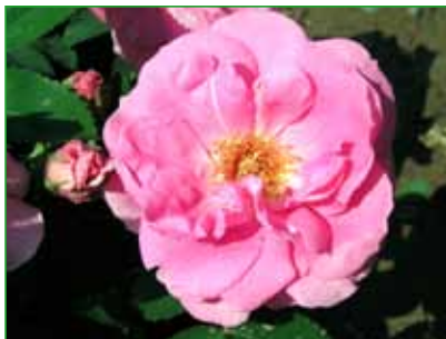
MILEVSKO, sadovka, L. Večeřa, M. Látová, 1980 foto 16

Sadová růže patří mezi rugosa hybridy. Vyniká kompaktním nižším vzrůstem a velmi ojedinělou barvou prázdných květů, jenž jsou bílé s světle růžovým orámováním.