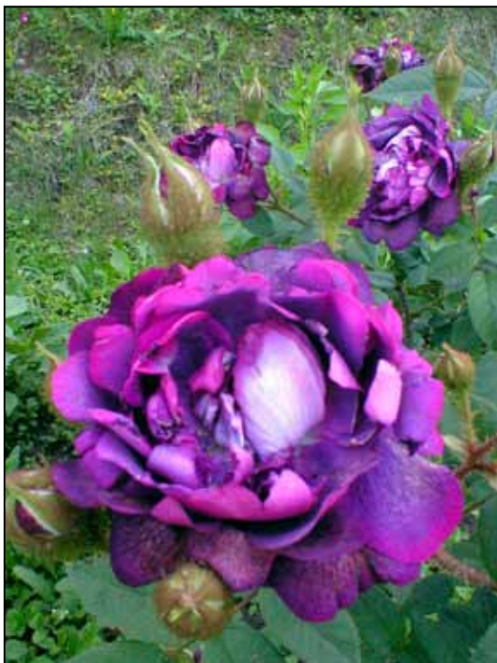
WILLIAM LOBB, mechovka, M. Laffay, 1855

General Jacquiminot, Jules Margottin, Persian Yellow (Willock 1833), La Reine (Laffay 1843), Triomphe de l'Exposition (Margottin 1855)