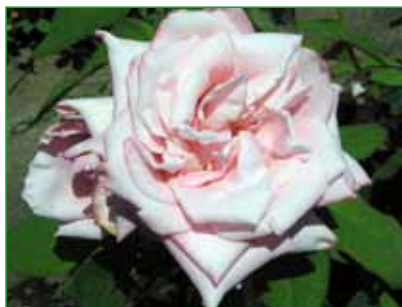
REGINA, HT, J. Urban sen., 1983

Vysoká sadová růže s mírně obloukovitě skloněnými výhony, květy jsou výrazně růžovočerveně zbarvené. Stavba květenství je volná, takže každý květ je dobře patrný. Okrasný význam mají i šípky objevující se někdy současně s posledními remontujícími květy.