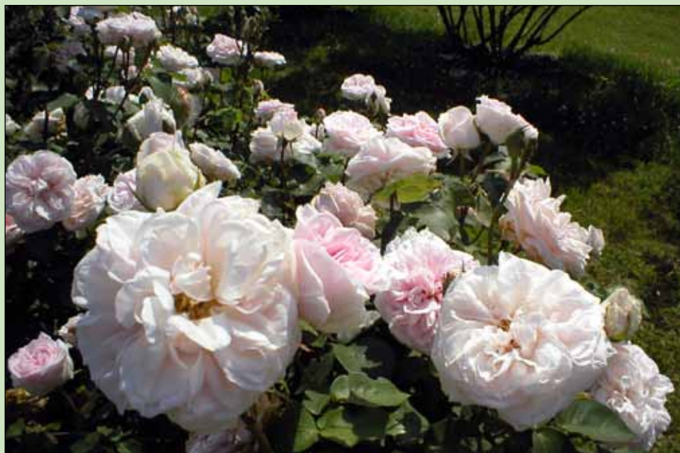
Souvenir de la MALMAISON, bourbonka, Béluze, 1843

K článku „Růže v českých zemích před 120 lety“