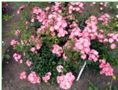
ROZTOMILÁ, polyantka, J. Urban, 1986