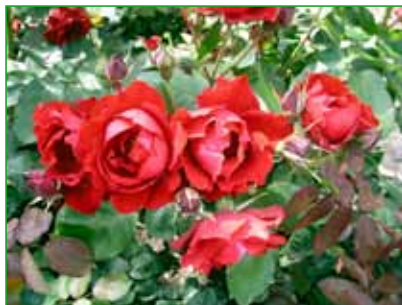
ROMANCE, polyantahybrid, J. Urban sen., 1975 foto 20