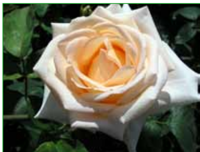
HELENKA, HT, R. Tesai, 1989 foto 8