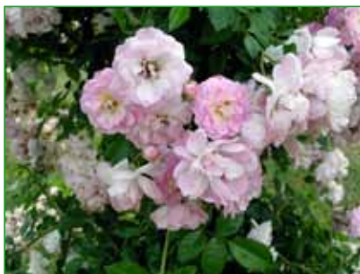
RUSALKA, pnoucí, Dr. G. Brada, 1934

Středně vysoká floribunda s volnou stavbou květu se vyznačuje proměnou červených poupat na pronikavě růžové květy.