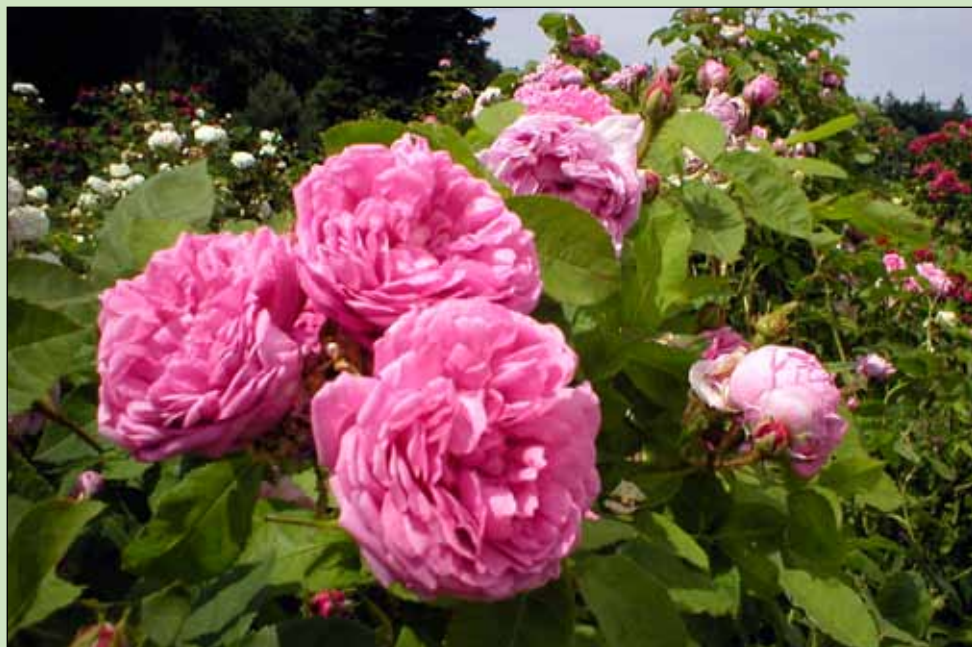
SALET, mechovka, Lacharme, 1845