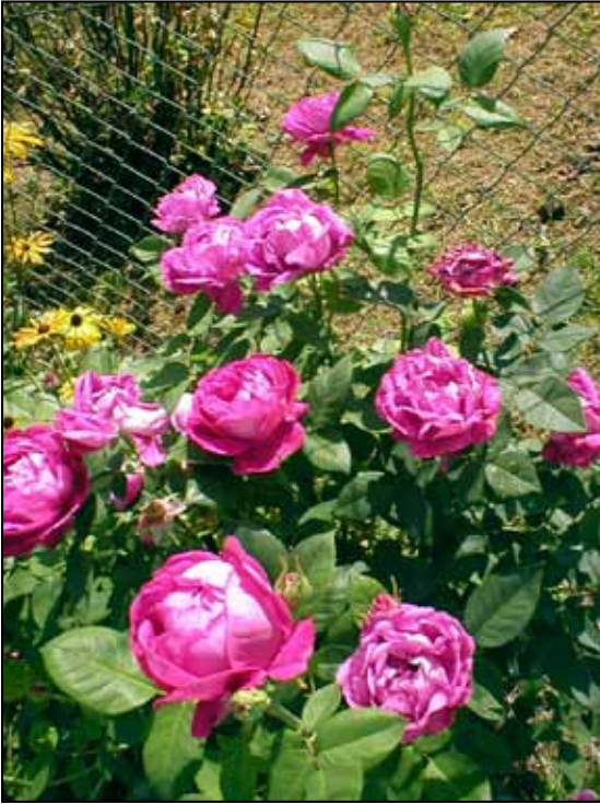
ULRICH BRÜNNER fils, remontantka, 1882

k -20° aby poté přes den vystoupaly až k +6°, což způsobilo velké ztráty na rostlinách.