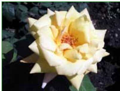
DUKÁT, HT, S. Brabec, 1980