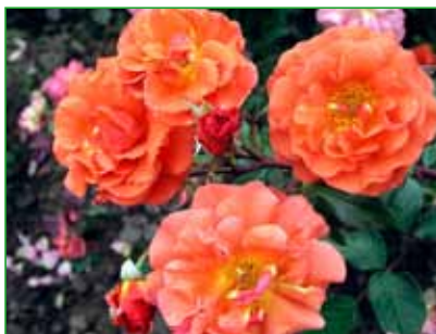
J. G. MENDEL, floribunda, J. Urban sen., 1989 foto 11