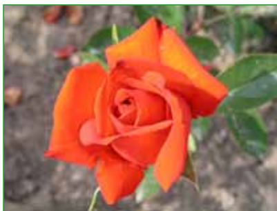
LIDKA, HT, J. Urban sen., 1985 foto 13