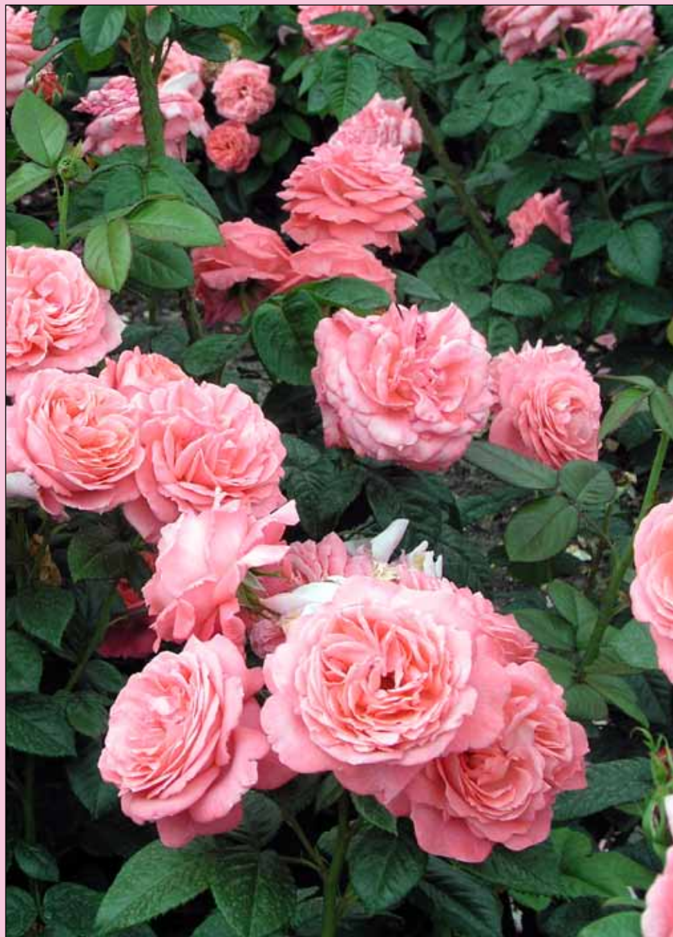
KORÉ, sadovka, J. Urban sen., 1980 - foto 12