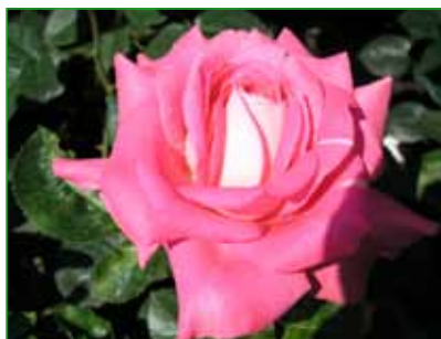
CANTILENA BOHEMICA, HT, J. Havel, 1977