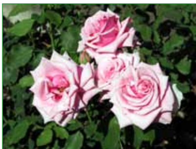
MORAVA, HT, J. Strnad, 1970