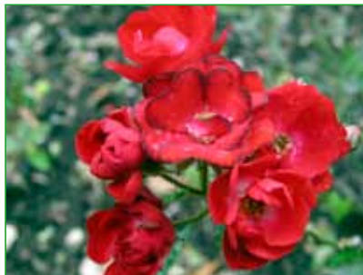
ČS. ČERVENÝ KRÍŽ, polyantka, J. Böhm, 1938 foto 3

Nový předseda ČZS vyslovil ochotu předložit problematiku finančně podpory genofundové sbírky růží českých šlechtitelů v Rajhradě (náklady činí odhadem na 0,5 mil. Kč ročně) na příslušném odboru MZe, které se zabývá genofondy obecně a dotacemi z EU. Očekává tedy oficiální žádost Rosa klubu ČR - připraví předseda s Ing. Zavadilem.