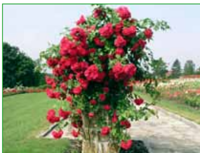
LUDVÍK VEČEŘA, pnoucí, L. Večeřa, M. Látová, 1976 foto 14